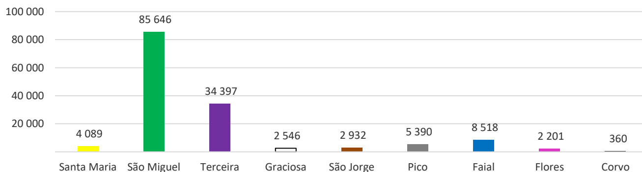
Figura 3 – Desembarque de passageiros, por ilha, no mês de referência.

Por ilha, todas, exceto o Faial (-4,9%), apresentam variação homóloga mensal positiva no desembarque de passageiros: Pico (+52,6%), Flores (+43,6%), Graciosa (+24,1%), Terceira (+17,6%), Santa Maria (+16,9%), Corvo (+11,8%), São Jorge (+11,1%) e São Miguel (+8,2%).